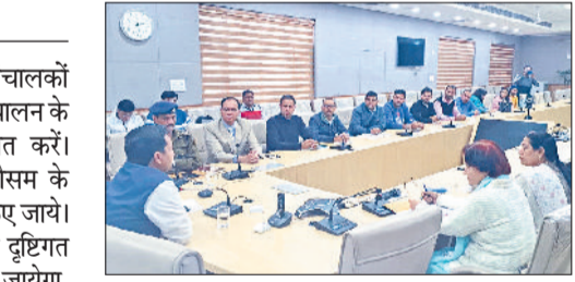
रोहतक। लघु सचिवालय में निजी स्कूल संचालकों के साथ बैठक लेते उपायुक्त सचिन गुप्ता।

उपायुक्त सचिन गुप्ता ने सभी निजी स्कूल संचालकों को निर्देश दिए कि वे स्कूल बसों के सुरक्षित संचालन के लिए सभी आवश्यक कदम उठाना सुनिश्चित करें। उन्होंने कहा कि आगामी सर्दी व धुंध के मौसम के दृष्टिकोण बच्चों की सुरक्षा के लिए सभी प्रबंध किए जायें। जिला प्रशासन द्वारा सर्दी व धुंध के मौसम के दृष्टिकोण बसों की चेकिंग का विशेष अभियान भी चलाया जायेगा, जिसमें उपमंडल समिति बसों की जांच करेंगी। डीसी सोमवार को लघु सचिवालय में निजी स्कूल संचालकों के साथ स्कूल बसों के सुरक्षित संचालन तथा धुंध के मौसम के दौरान बच्चों की सुरक्षा के दृष्टिकोण आयोजित बैठक की अध्यक्षता कर रहे थे। उन्होंने कहा कि स्कूल संचालक सुरक्षित स्कूल वाहन पॉलिसी के सभी मानकों एवं सर्वोच्च न्यायालय द्वारा दी गई दिहायतों की दृढ़ता से