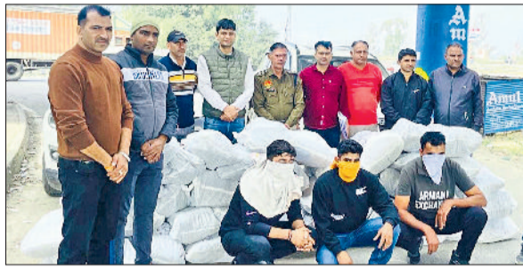
रोहतक। नशा तस्करी के आरोपित पुलिस की गिरफ्तार में