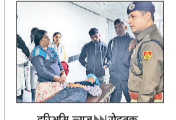
हरिभूमि न्यूज रोहतक