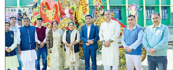
महम। गीता जयंती समारोह में भाग लेते अधिकारी, शिक्षक व जनप्रतिनिधि।