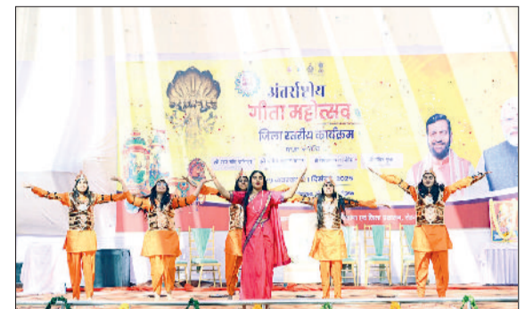
रोहतक। कार्यक्रम में अपनी प्रस्तुति देते प्रतिभागी।