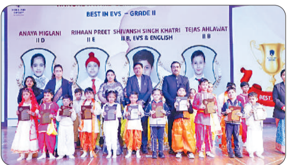
रोहतक। स्कॉलर रोजरी स्कूल के वार्षिकोत्सव में सांस्कृतिक कार्यक्रम प्रस्तुत करते विद्यार्थी व समारोह में विजेताओं को सम्मानित करते मुख्य अतिथि।